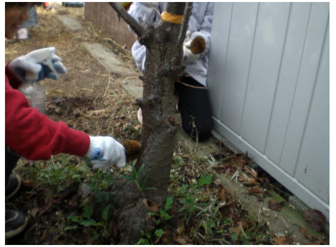
タワシで幹の苔取り