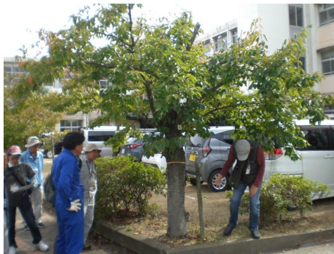
スタッフ下見打合せ