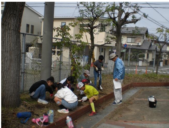
NO. 17 桜