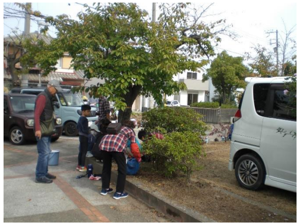
NO. 16 桜