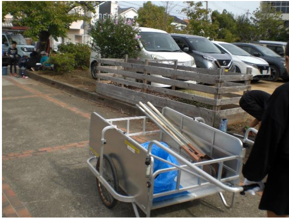
堆肥とダブルスコップ運搬