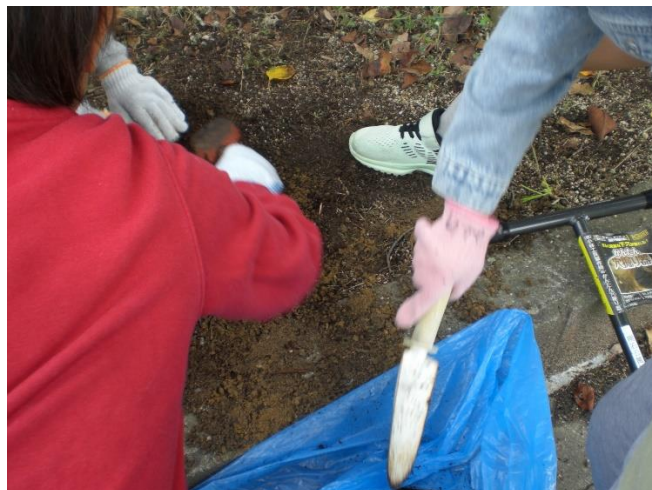
割竹埋設箇所へ堆肥入れ