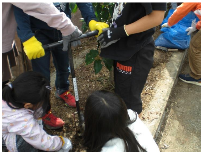
割竹工法（穴掘りドリルで穴あけ）