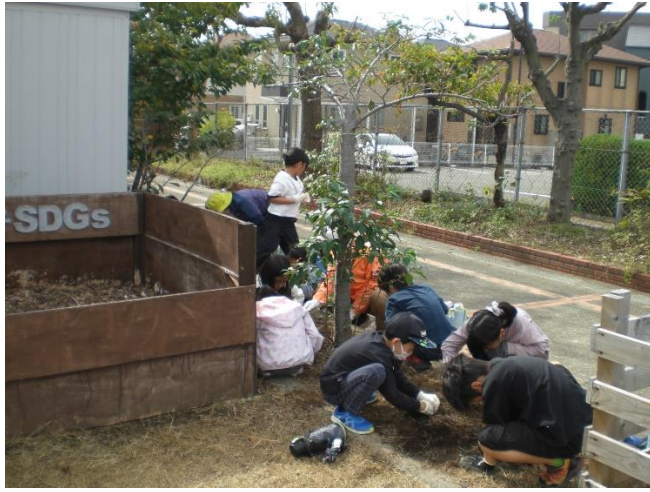
プラスドライバーで穴あけ