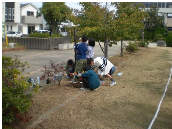
NO. 19 桜