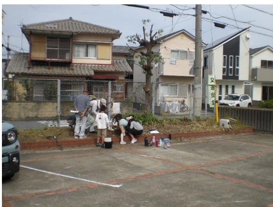
NO. 23 桜