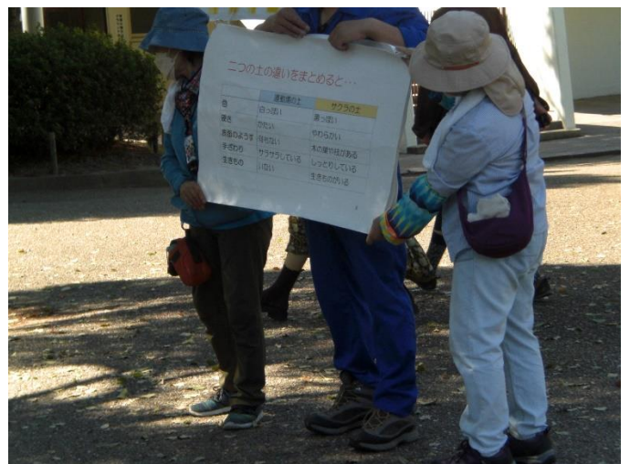
運動場の土と桜が植わっている場所の土との違い