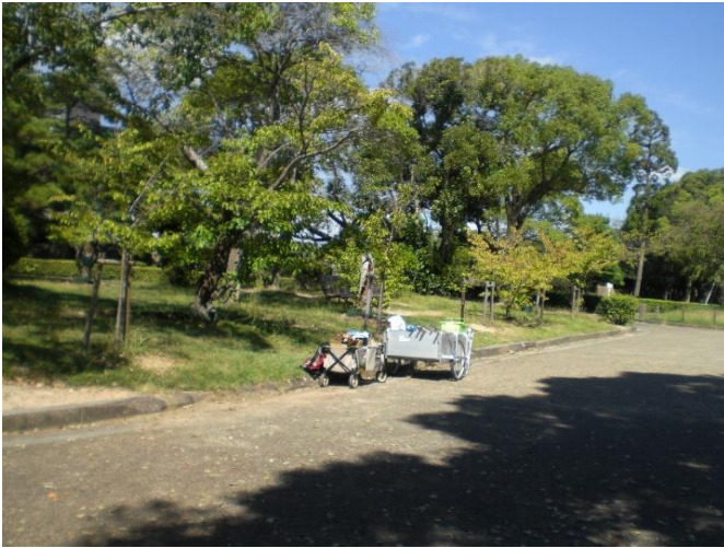
桜の手入れ箇所全景