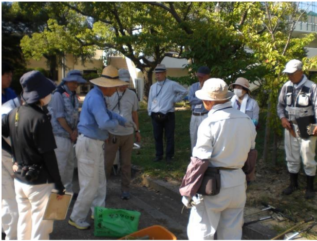
スタッフミーティング(解説の統一確認)