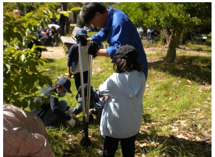
石があり硬い土はダブルスコップで穴掘り