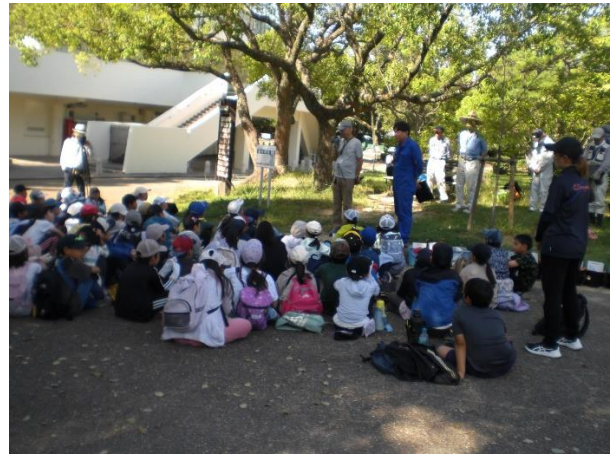
はじめの会ドライバー使い方説明(桜守ボランティア代表)