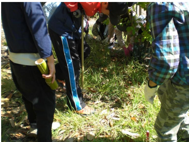
割竹工法(穴掘りドリルで穴あけ)