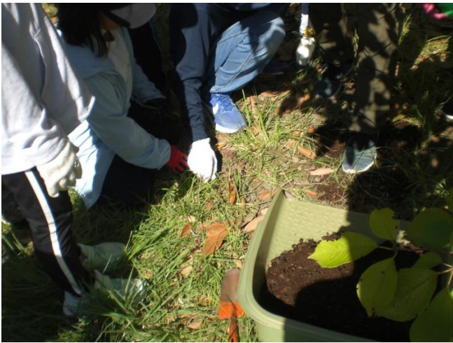
割竹埋設箇所へ堆肥入れ