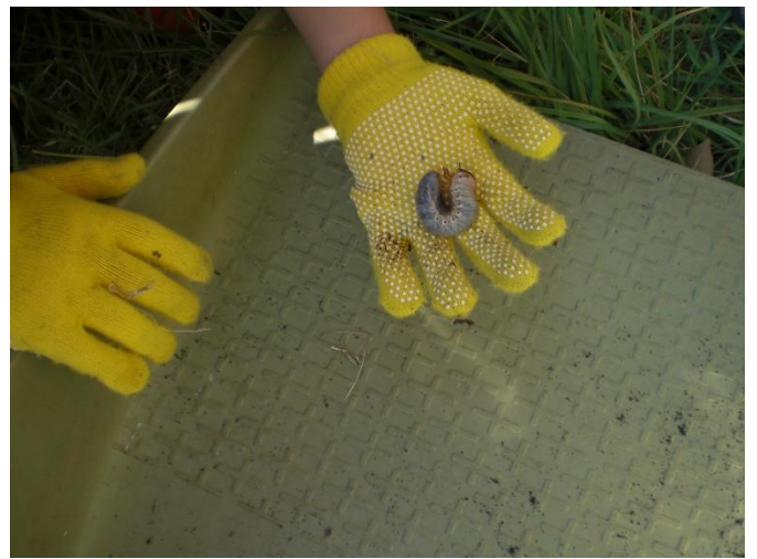
堆肥の中からカブトムシの幼虫