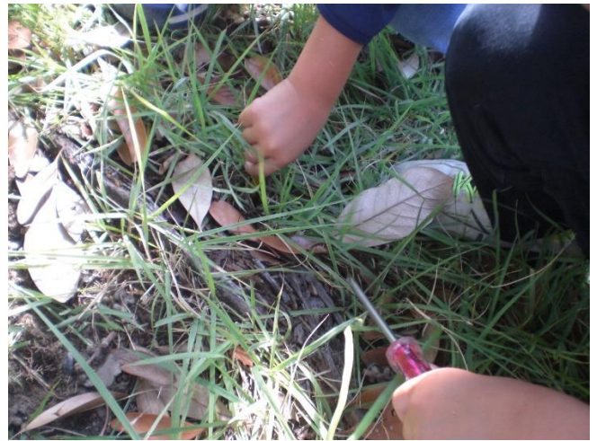
プラスドライバーで穴あけ