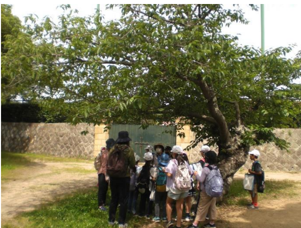
根元のコンクリートを撤去して樹勢回復した木