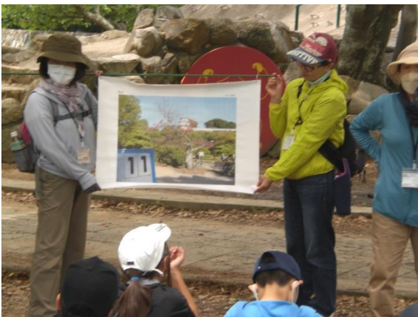
5年前手入れ前の写真