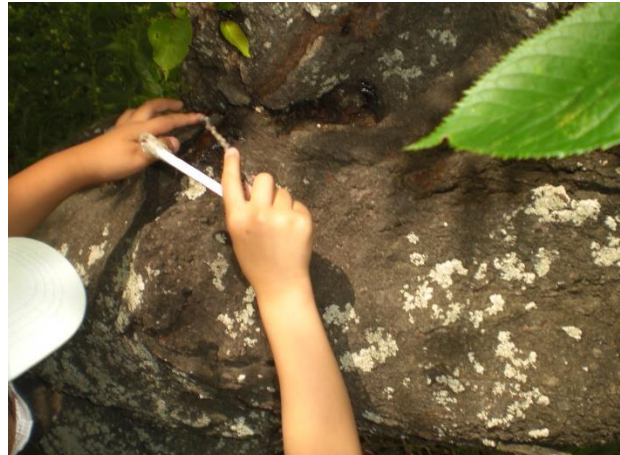
ヤニが固まってきた観察