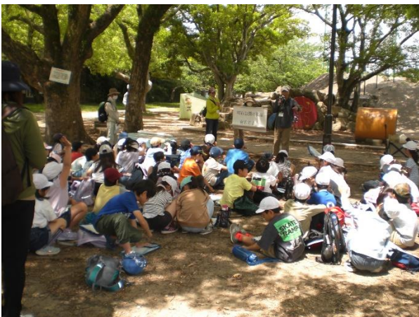
ソメイヨシノのお話