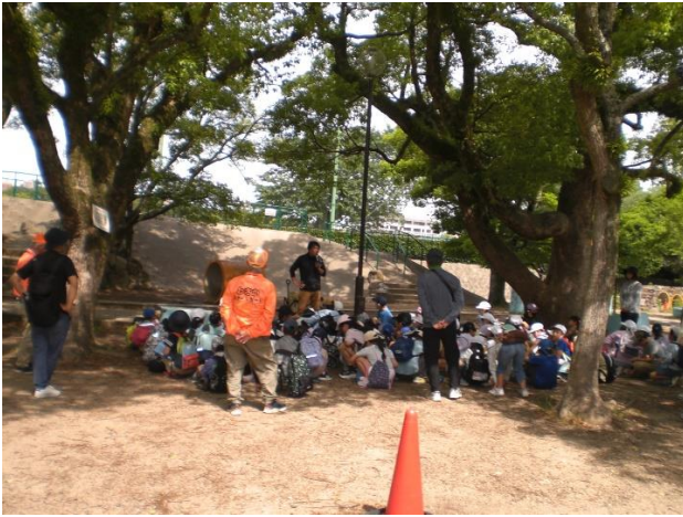
はじめの会で今日の活動内容説明