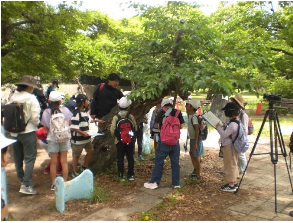
大きな穴が開いた木の解説