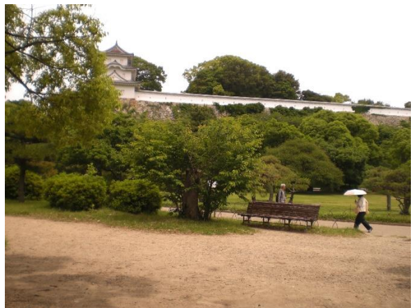
樹勢回復入れ後の桜の姿