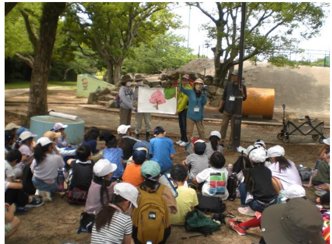
桜守ボランティア活動のお話（グリーンパイル）