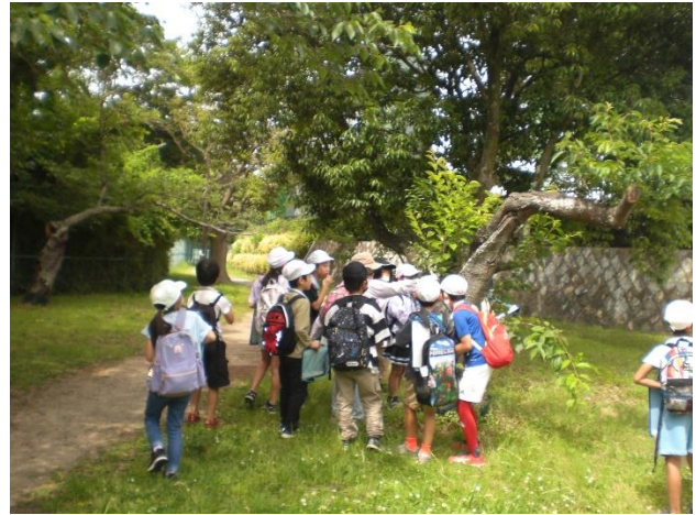
不定根ができて樹勢回復してきている