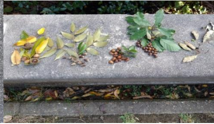
クヌギ、スダジイ、ウバメガシ、アラカシ、クスノキ