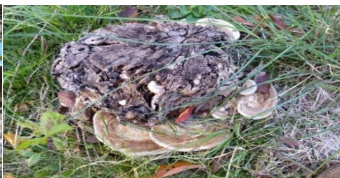
切株に発生したカイガラタケ（白色腐朽菌）