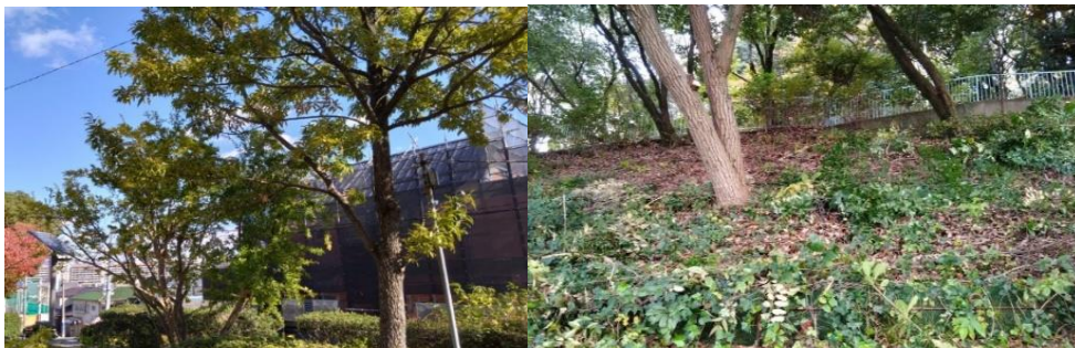
ザクロ、クヌギの透かし剪定

なお、安全な樹林を形成するために危険木の除去、見通しのための剪定等管理活動を行う。