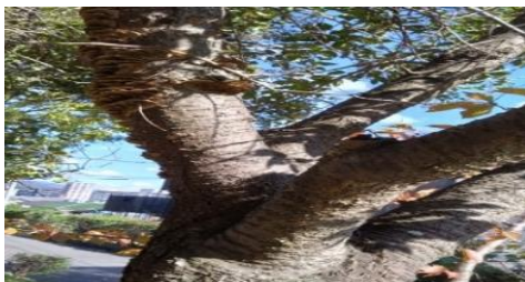
ソメイヨシノの枯枝に発生したカワラタケ（白色腐朽菌）