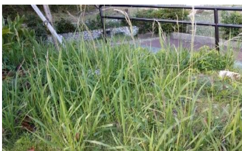
タチスズメノヒエ（侵略的外来種）