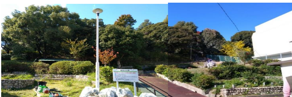
低木の剪定・刈込及び侵略的外来種の除草