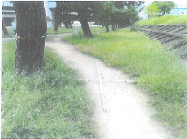
<矢板打込機械作業ライン>